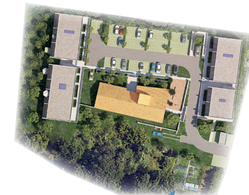
Jardin partagé & ruches

En plus du bois présent sur le site, les habitants pourront profiter d'un espace vert commun planté, permettant des activités de plein air au pied des bâtiments d'habitation. Situé en coeur d'îlot, il assure un éclairage et un ensoleillement optimal pour les logements, tout en offrant aux riverains et habitants, l'agrément d'une vue sur un beau parc intérieur. »